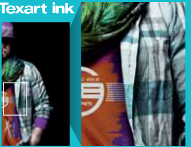
Los tonos vivos de color naranja y violeta se combinan con negros profundos y atarciopelados para conseguir unos colores brillantes y equilibrados.